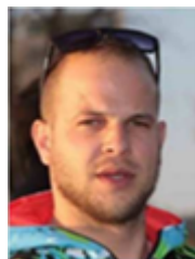
Rally1, Orc, Hist-