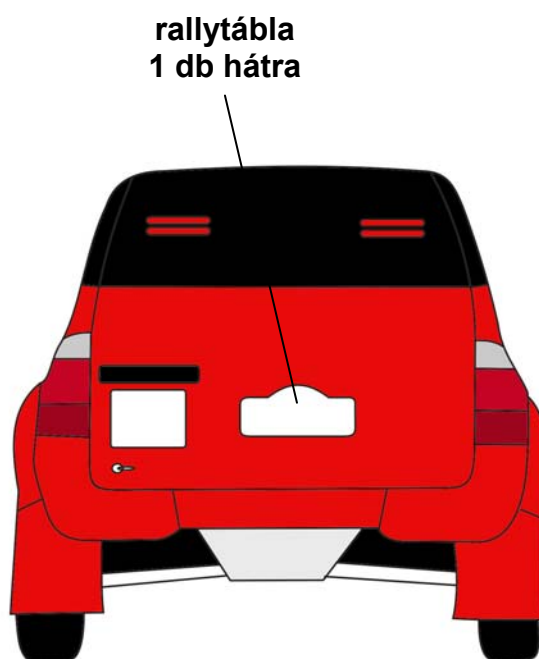
rallytábla 1 db hátra